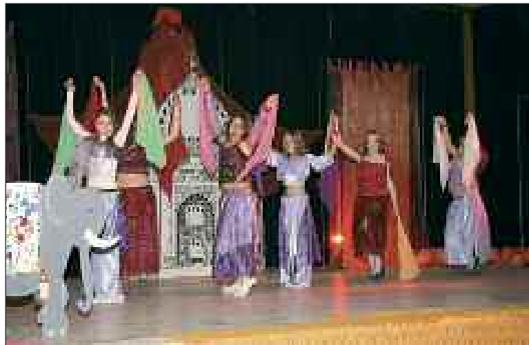
Sur la scène de la salle des fêtes