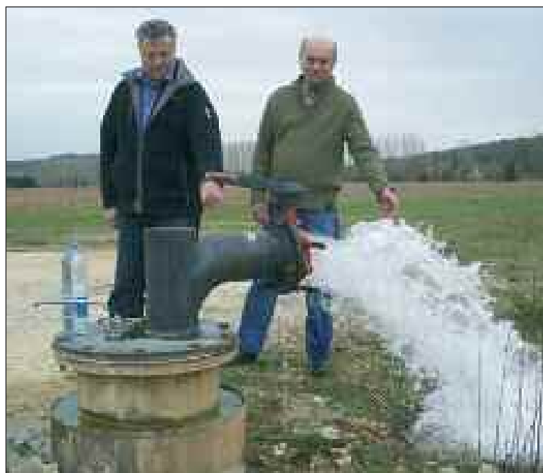
Les président et vice-président du SIAEP devant le forage de la Rochette

Lundi 22 mars, c'est en présence des responsables des divers services administratifs : DDAF, SDS, Cesu, Véolia, et des élus délégués des dix communes adhérentes au SIAEP (Syndicat intercommunal d'alimentation en eau potable) de Saint-Léon-sur-Vézère que s'est tenue la réunion du comité syndical.