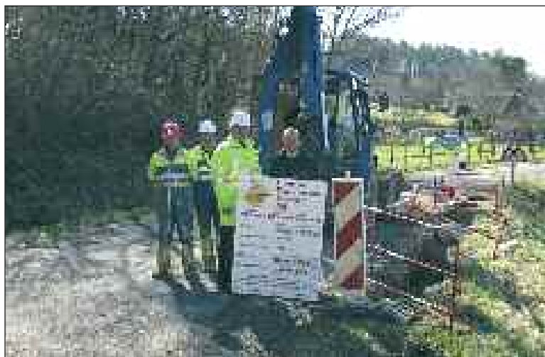
Le maire avec des membres de l'entreprise