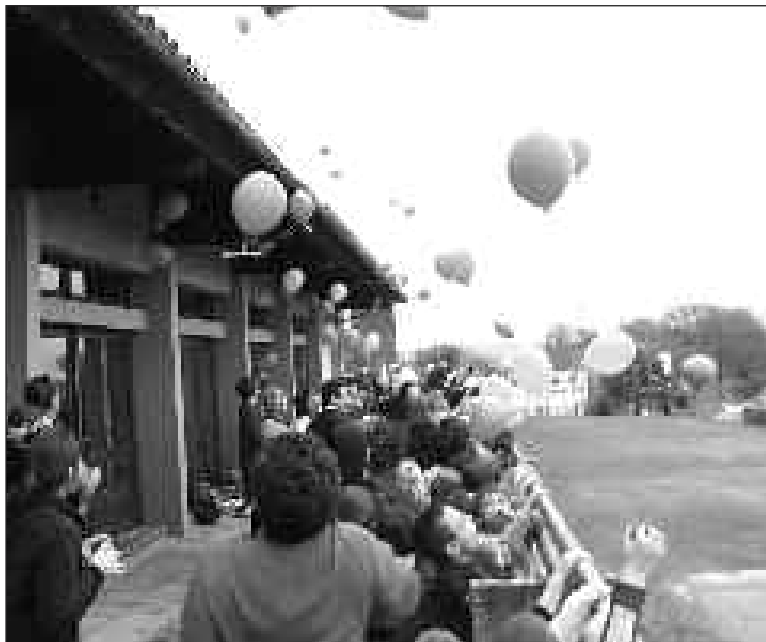
Cinq cents élèves étaient rassemblés