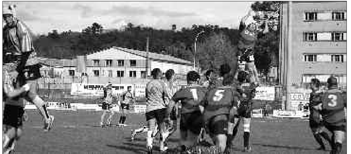
La bataille des airs