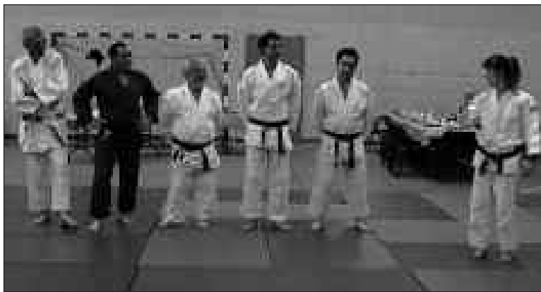
Les anciens professeurs réunis sur les tatamis